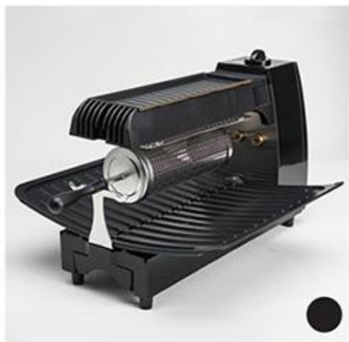
BRATENエコグリリングリル(ブラック)