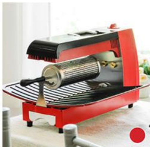
BRATENエコグリリングリル(レッド)