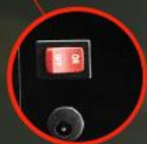
自動回転 スティックのスイッチ