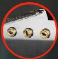
回転式ロースト缶 串差し穴