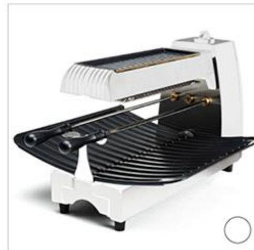
BRATENエコグリリングリル(ホワイト)